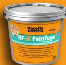
Racofix® RF-X Feinfuge

Diese Produkte werden durch die neue Multi-Flexfuge Plus ersetzt und in Kürze nicht mehr lieferbar sein: