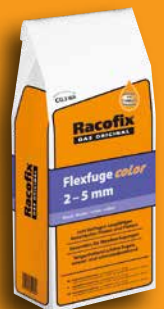
Racofix® Flexfuge color